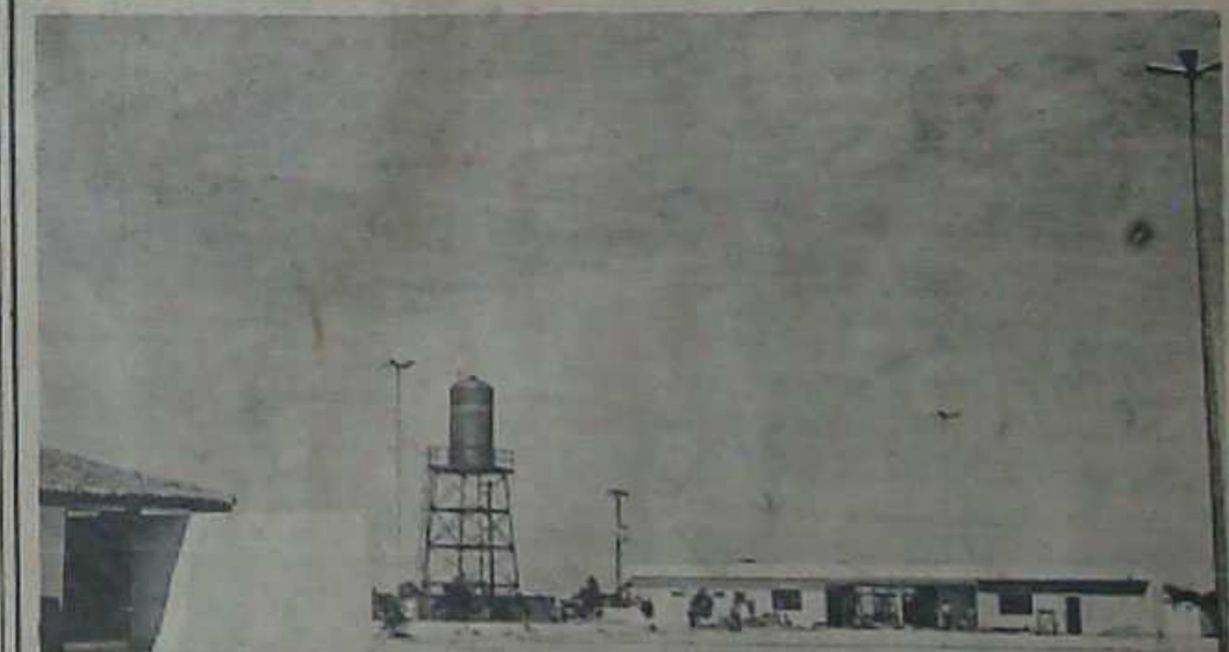
Será inaugurado no próximo mês