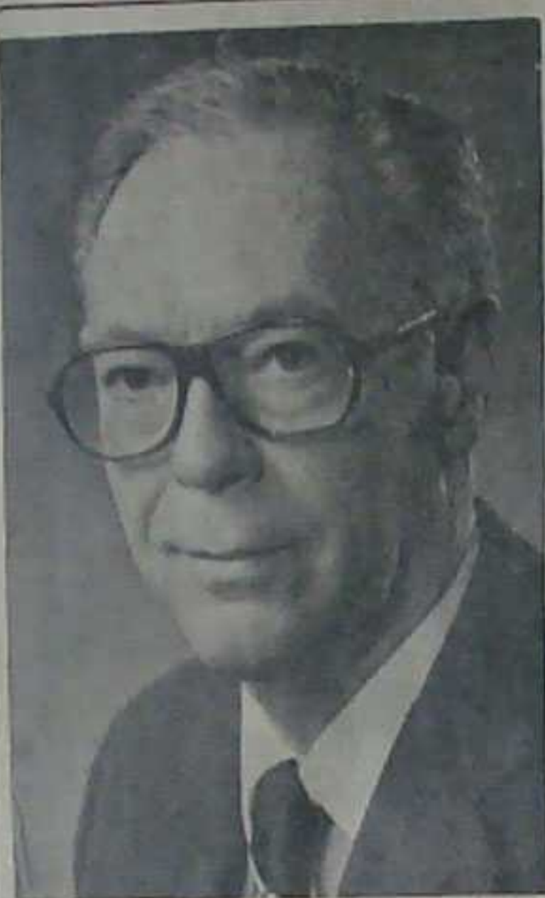
O diplomata permanecerá três dias nesta Capital

O Maracanã deve apresentar hoje na decisão entre Flamengo e Vasco da Gama o recorde de arrecadação em todo o Brasil. Se ganhar, o Flamengo conquistará o título desta temporada. Se houver empate o Vasco será o campeão do retorno - sairá para uma decisão em melhor de quatro pontos com o Mengo. Todos os detalhes da grande decisão carioca estão na página 8 (Esportes)