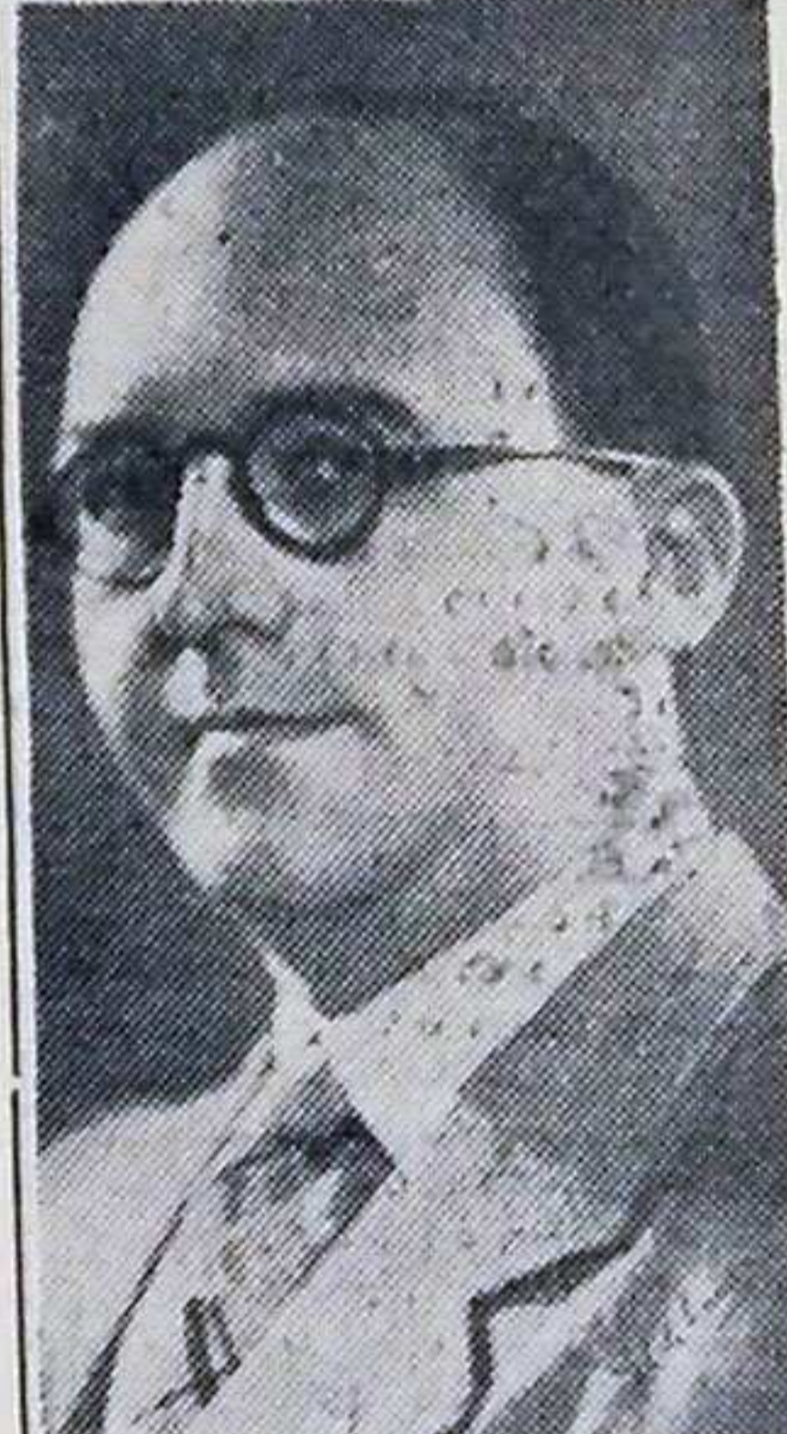
Ministro Valdemar Falcão, que volta encantado com o Rio Grande

ocasião de observar o grande surto industrial da região, que desdobra-se em tres faces pujantes vinicola, tecidos e instrumentos de metal. Esta região caracteristica pelo seu aspeto colonial, pois nela é que condensa-se a imigração estrangeira, serviu perfeitamente porrem para mostrar-me a elevação da mentalidade e solidez economica do Rio Grande. Os seus homens de industria, da pecuaria, do comercio ou da agricultura, todos trabalham, tendo em vista o progresso e a grandeza do Rio Grande. Foi-me sobremodo agradável observar a colaboração que o governo do Estado dá a todas as classes produtoras gaúchas é integral, completa e principalmente bem compreendida e magnificamente re- (Continua noutro local)