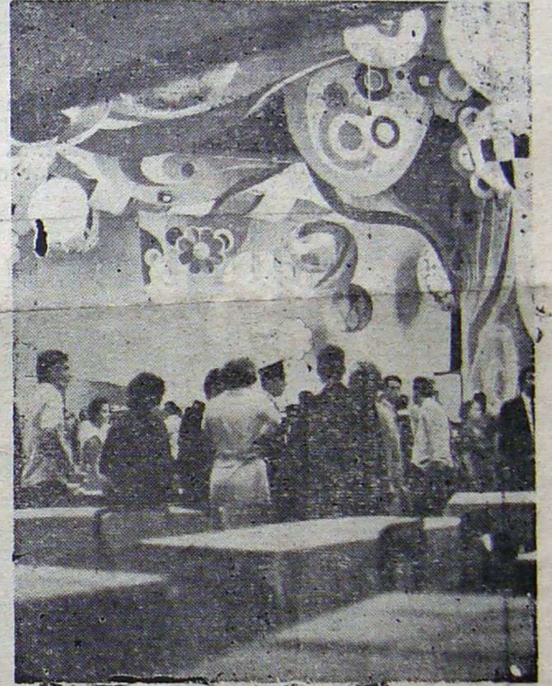
A decoração dos clubes depende de muito gosto

Ocorre, entretanto, que no carnaval os conjuntos musicais e as orquestras se mostram, de fato, incapazes de seguir qualquer roteiro musical pré-traçado. No tríduo e, até desde antes, os músicos geralmente se desdobram numa atividade imoderada e estonteante, avidos de atender aos numerosos compromissos que assumem por contrato — escrito ou de booa; é como se disputassem uma gincana... Não são raros os casos em que acabam "roendo a corda" com algum clube, cu cometendo outras raticões. Mais amíde, porém, cumprem sua "tarefa" de maneira rasa e formal, como se desempenhassem um ofício mecânico, com o mais solene desinteresse pelo sucesso do baile. Atuando na base da improvisação, exaustos ou displicentes, incidem em falhas que inevitavelmente repercutem no estado de animo dos que estão embalados na folia. Demoram-se demoradamente na execução de determinado ritmo, quan